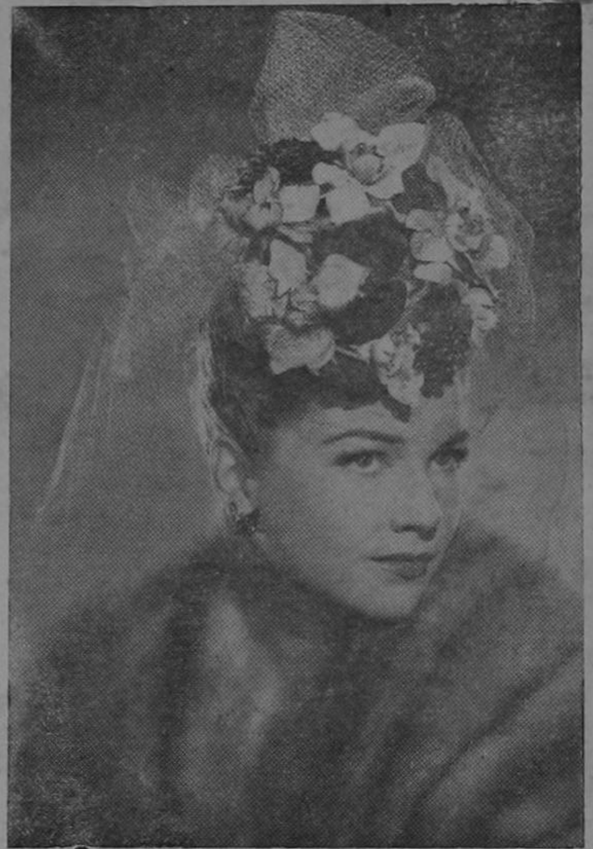
Joven turca madre de trillizos cuya paternidad se achaca al diputado don Rodrigo Sancho.