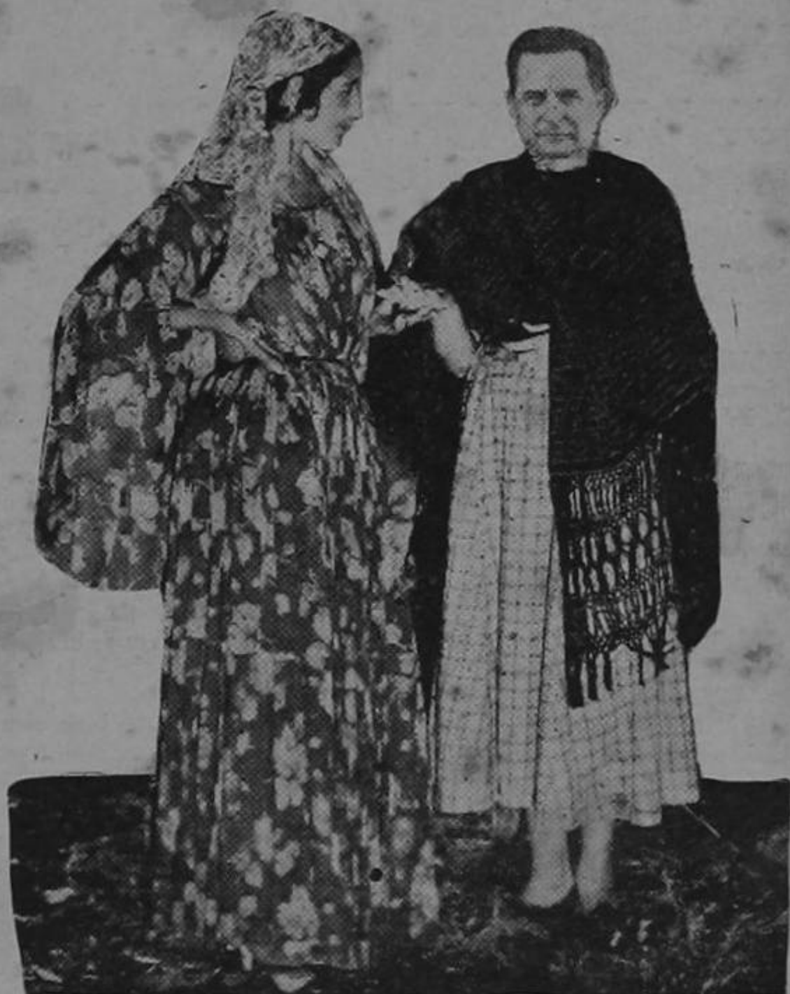
EL PILON DEL BANCO:—Léame mi porvenir? ¿Quiere?